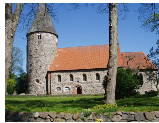
Feldsteinkirche in Ratekau

9.00-18.00 die Kirche ist geöffnet 10.00-11.00 es findet ein Gottesdienst statt ca. 11.00 es findet eine Kirchenführung statt