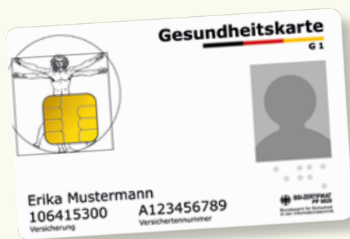
Exemple type d'une carte de santé

Quand vous avez recours à des services de santé, apportez toujours votre carte électronique de santé (elektronische Gesundheitskarte). Depuis le 1er janvier 2015, c'est exclusivement cette carte qui vaut comme justificatif d'assurance permettant d'avoir accès aux prestations de l'assurance maladie légale. Sur la carte électronique de santé figurent votre nom, votre date de naissance et votre adresse ainsi que votre statut d'assuré (membre, membre de la famille coassuré ou retraité) comme données obligatoires. La carte électronique de santé est en outre munie d'une photo de vous.