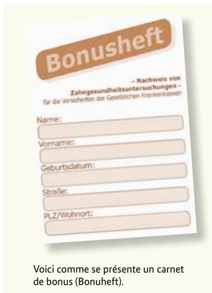
Voici comme se présente un carnet de bonus (Bonuheft).

Les dents saines contribuent à la qualité de vie. C'est pourquoi les examens préventifs réguliers sont importants – même si vous n'avez pas de problèmes. Les caisses maladie légales prennent également les frais de ces examens préventifs en charge. Ces examens aident à dépister et à traiter à temps certaines maladies. Votre caisse maladie vous remet un carnet bonus (« Bonusheft ») à cet effet. Les examens de prévention sont inscrits dans ce carnet. Si vous pouvez prouver que vous êtes allé(e) au moins une fois par an chez le dentiste (au moins une fois tous les six mois pour les personnes de moins de 18 ans), la caisse maladie rembourse une indemnité plus élevée si une prothèse dentaire est nécessaire.