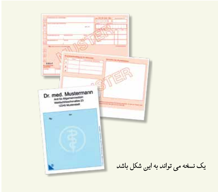
یک نسخه می تواند به این شکل باشد