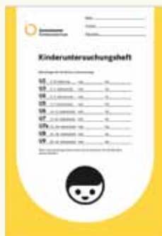
Lênivîsa pişkinînan (U-Heft) bi vî rengî ye.

Ev pişkinînên han zor giring in. Ji kerema xwe re, ji ber wê hindê pêdivî ye, ku hun pişkinînan bi cedî bistînin û herdem di gel xwe wê lênivîsa pişkinînan (U-Heft) û lênivîsa vaksînlêdanê ya zaroka xwe bînin. Ew pişkinîn ji bo tendurustiya zaroka we ye.