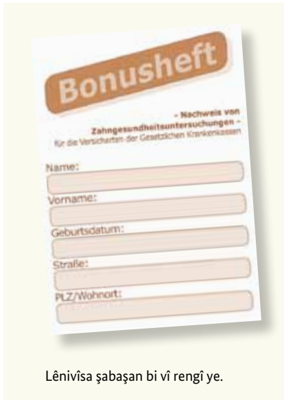
Lênivîsa şabaşan bi vî rengî ye.

Diranên saxlem parçeyek in ji qalîteya jiyane ne. Ji ber wê jî bi şeweyekî berdeham pişkinîna wan giring e, eger we çu gazinde û êş jî ji diranên xwe nebin. Qasa sîgorta tendurustiyê ya yasayî hemî mesref û xerciyên xizmetguzariya pişkinînê jî bi xwe digire. Ev pişkinîn jî dibin alîkar, bo hin nexweşiyên destnişankirî, ku berwext bêne diyarkirin û naskirin û her weha dermankirin. Hun dikarin ji sîgorta xwe ya nexweşiyê wek tê gotin “lênivîsa şabaşan” (Bonusheft) werbigirin. Di wê lénivîsê de pişkinînen we yê hun bikin tene nivîsin. Eger hun bikaribin, ku we bi kêmanî salê carekê (di bin 18 salî re bi kêmanî her niv salê carekê) diyar bikin, ku we seredana bijîjkeka diranan an bijîjkekî deranan kiriye, wê qasa sîgorta we ya nexweşiyê perene zêde di ser re bide, eger şûndiraneke pêdivî be.