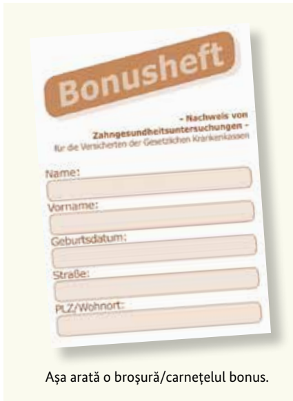
Așa arată o broșură/carnețelul bonus.

Dinții sănătoși sunt un fragment din calitatea vieții. De aceea sunt importante consulturile regulate – chiar dacă nu aveți plângeri. Casele de sănătate obligatorii preiau și costurile acestor consultații preventive. Aceste investigații ajută la recunoașterea și tratarea din timp a anumitor îmbolnăviri. Pentru acest lucru puteți primi un așa-numit „Bonusheft/Carnet bonus“ din partea casei dumneavoastră de sănătate. În acest caiet se înregistrează consultații regulate. Dacă puteți dovedi că ați consultat minim o dată pe an (sub 18 ani minim o dată la jumătate de an) un dentist, casa de sănătate vă plătește o subvenție mai mare în cazul în care devine necesară o proteză.