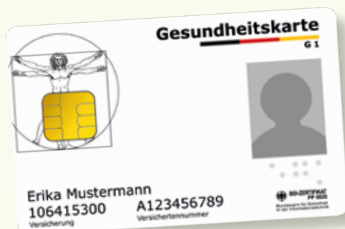
Exemplu model al unui card de sănătate

Va rugăm să aveți cardul electronic de sănătate permanent la dumneavoastră, când utilizați serviciile de sănătate. Începând cu 1 ianuarie 2015 acest card este exclusiv valabil ca dovadă de autorizare pentru a putea beneficia de serviciile asigurării de sănătate obligatorie. Pe cardul electronic de sănătate sunt salvate ca date obligatorii numele, data nașterii și adresa dumneavoastră cât și numărul dumneavoastră de asigurat medical și situația dumneavoastră de asigurat (membru, asigurat al familiei sau pensionar). Cardul electronic de sănătate conține și o fotografie cu dumneavoastră.