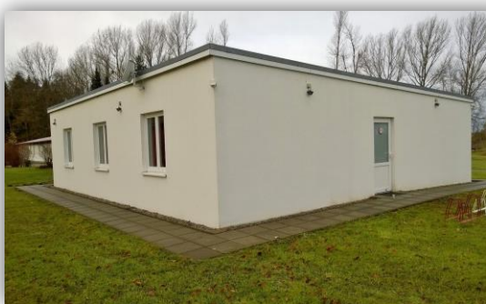
Anbau (Haus IV)