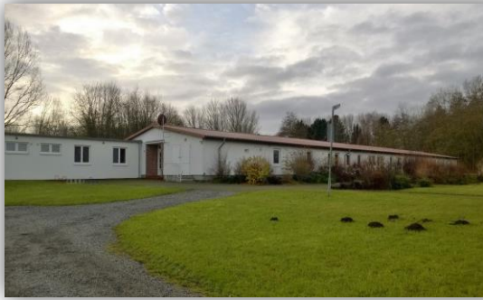
Blick von Nordost auf Haus I und IV