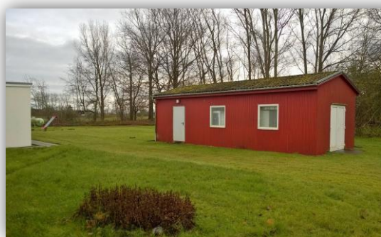
Freizeithalle (Haus III)