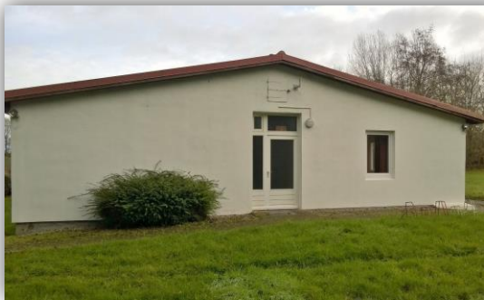
Westlicher Zugang zu Haus I