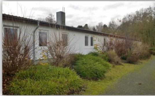
Nordansicht Haus I