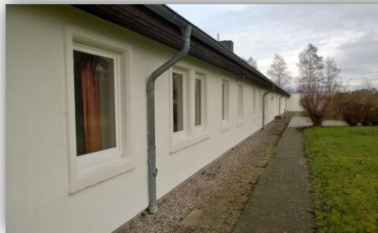
Südansicht Haus I