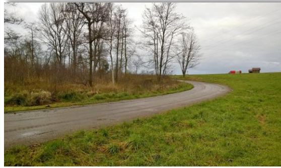
Zuwegung von der B 502