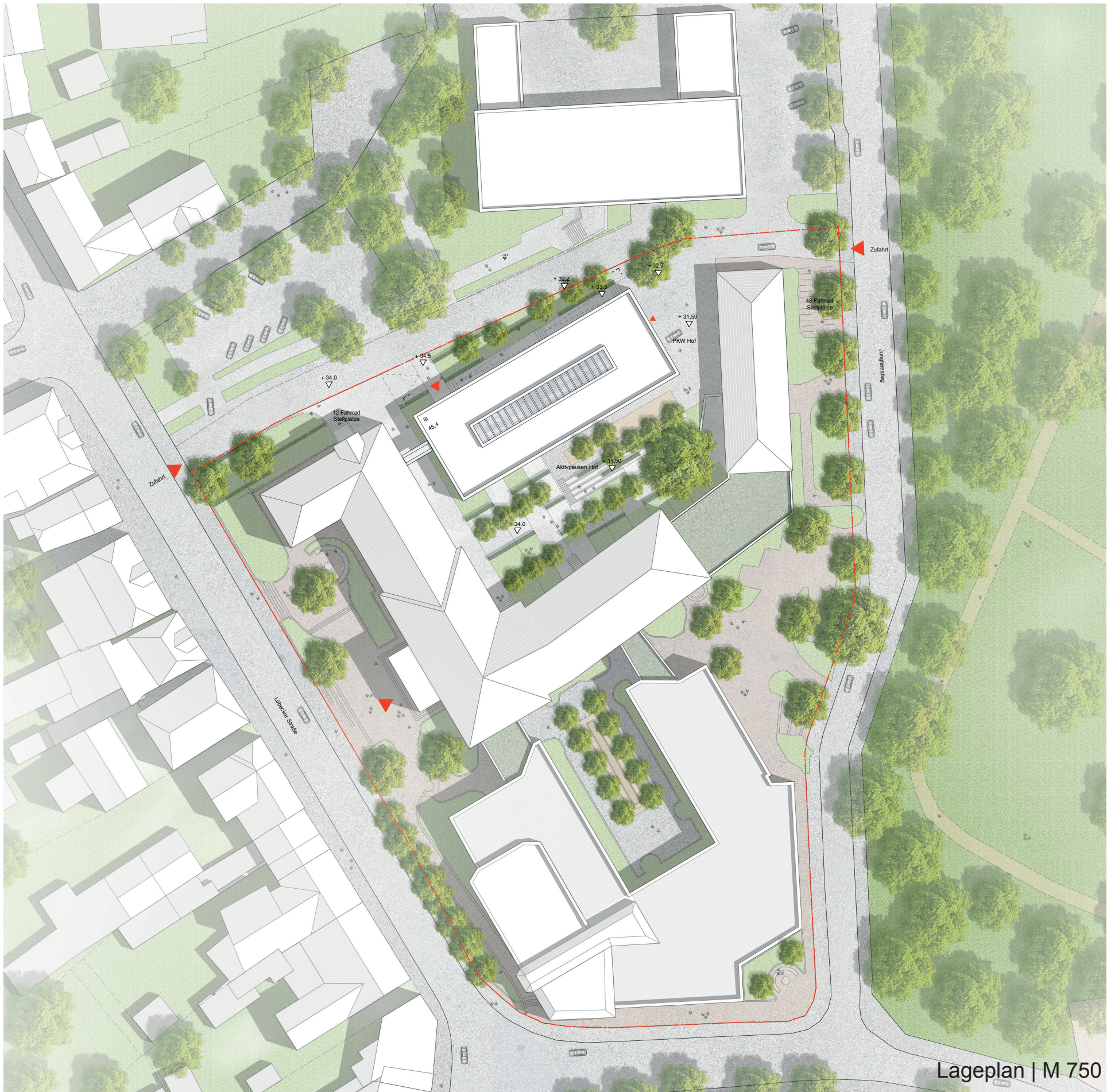
Erweiterungsneubau für die Kreisverwaltung Ostholstein