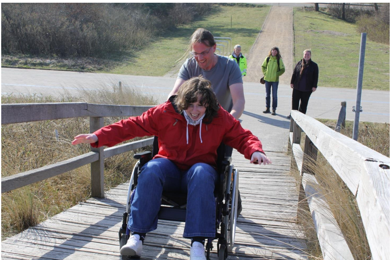
Strandzugang, Bildquelle: Fachschule für Sozialpädagogik Lensahn