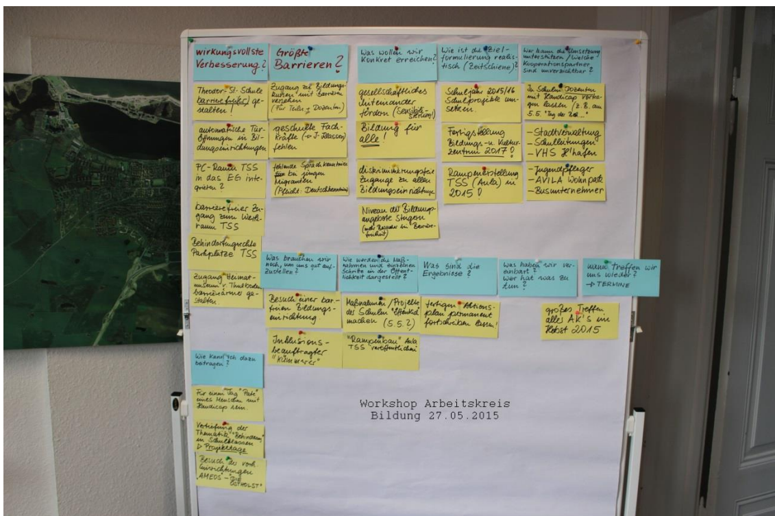
Bilderprotokoll der Arbeitskreissitzung Bildung am 27.05.2015

Die Arbeitskreissitzungen haben dann im März und Mai 2015 mit unterschiedlichen Personenanzahlen aus diversen Bereichen stattgefunden.