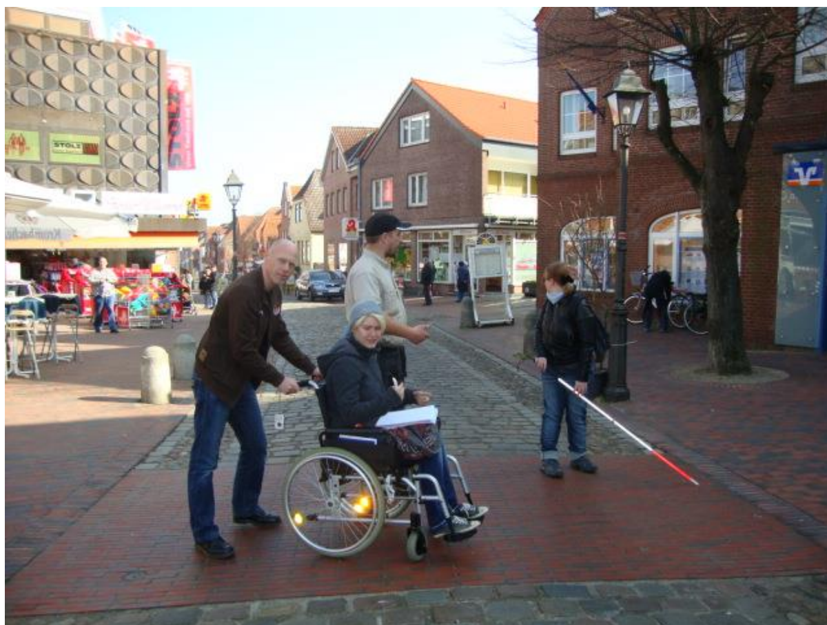
Barrierefreier Übergang in der Brückstraße

Die Reihenfolge, in der die Maßnahmen genannt sind, lässt keinen Schluss auf Prioritäten zu.