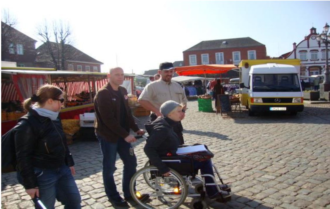
Rollstuhlfahrerin auf dem Heiligenhafener Marktplatz

Zudem ist die Aufzählung von körperlichen, seelischen, geistigen und Sinnesbeeinträchtigungen ein Hinweis darauf, wie vielfältig diese Gruppe von Menschen ist, die als „Menschen mit Behinderungen“ bezeichnet wird. Studien zeigen, dass Befragte beim Begriff „Behinderungen“ zumeist an Rollstuhlfahrerinnen und -fahrer oder Menschen mit Down-Syndrom denken.