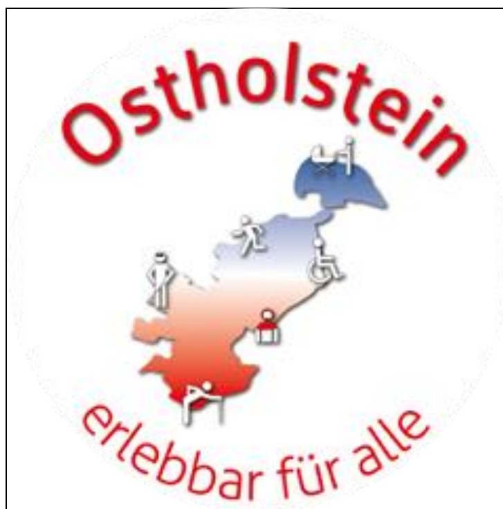
Logo des Projektes

Weil Ziele und Maßnahmen dabei nicht immer trennscharf voneinander abgegrenzt werden können, gibt es teilweise inhaltliche Überschneidungen.