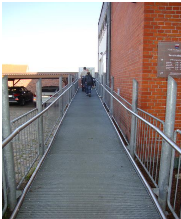
Barrierefreier Zugang Rathaus, Bildquelle Fachschule für Sozialpädagogik Lensahn