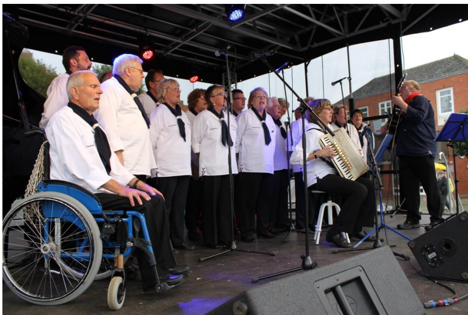
Auftritt auf der Marktplatzbühne, Bildquelle: Stadt Heiligenhafen