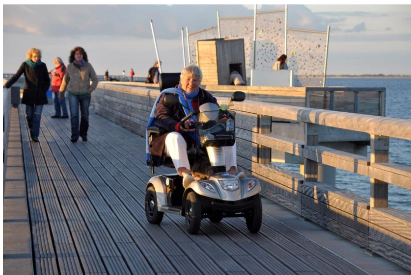
Seebrücke Heiligenhafen

Alle Rückmeldungen fließen in die regelmäßige Fortschreibung des Aktionsplans ein.