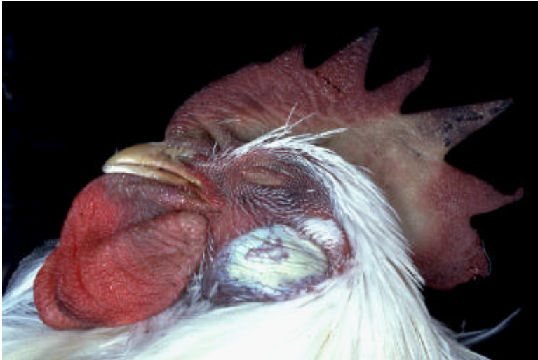
Abb. 3: Blutungen und Nekrosen an Kamm und Kehllappen eines nach experimenteller Infektion an Klassischer Geflügelpest gestorbenen Hahnes.