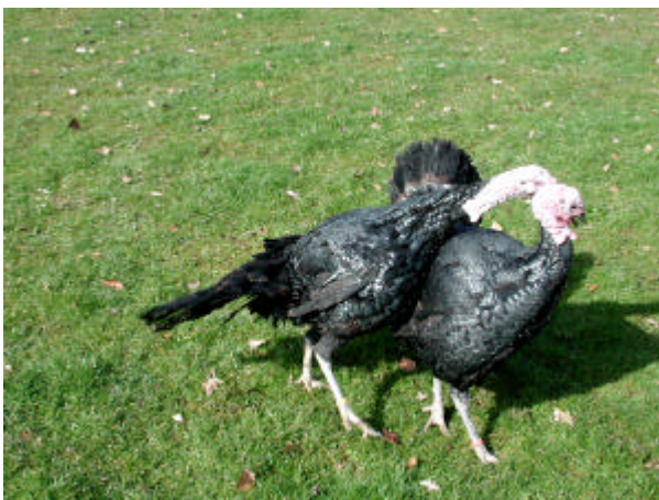
Abb. 7: Geflügel in Freilandhaltung kann durch Wildvögel mit Aviärer Influenza angesteckt werden. In Hausgeflügel kann der Erreger seine Pathogenität steigern und zum Ausbruch der Geflügelpest führen.