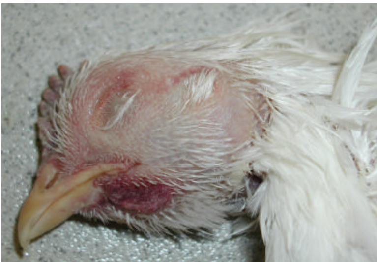
Abb. 4: Ödeme am Kopf eines an Klassischer Geflügelpest ver- endeten Huhns.