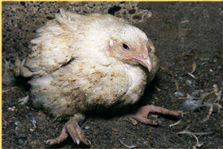
Abb. 2: An Klassischer Geflügelpest erkranktes Hühnchen mit gesträubtem Gefieder, halb geschlossenen Augen und auf den Tarsalgelenken hockend.