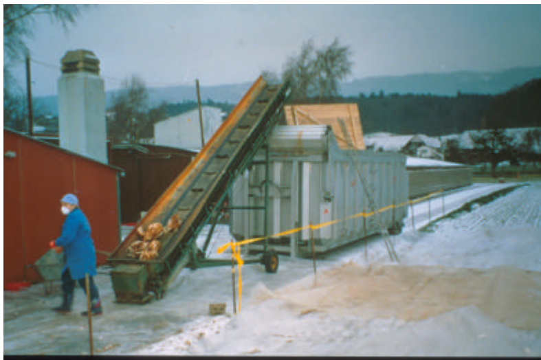
Abb. 8: An Geflügelpest verendete und getötete Hühner werden in Entsorgungsanlagen un- schädlich beseitigt.

Menschen müssen einen ungeschützten Kontakt mit erkrankten Tieren durch geeignete Schutzkleidung, Schutzhandschuhe, Mundschutz und Schutzbrille vermeiden. Personen, die sich in den betroffenen Regionen aufhalten und Kontakt zu Geflügelhaltungen haben, wird die Influenza-Schutzimpfung mit dem zugelassenen Impfstoff empfohlen. Damit soll eine Doppel-Infektion mit aviärem und humanem Influenzavirus vermieden werden.