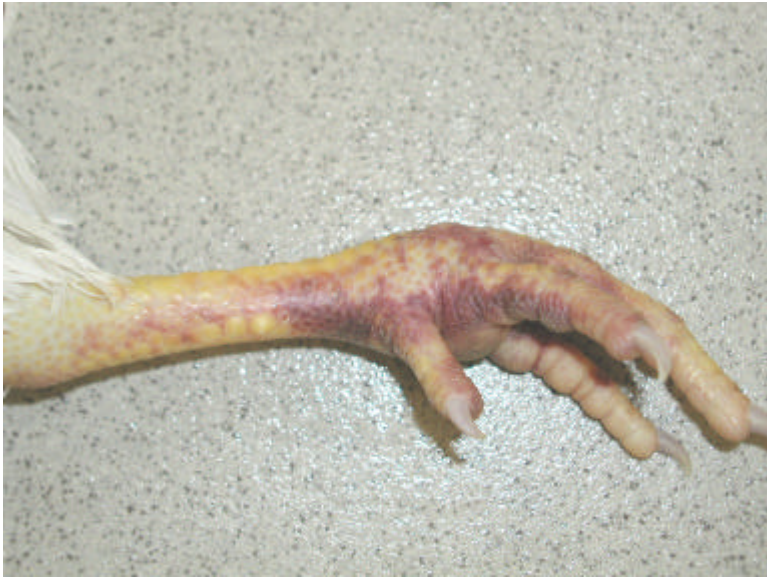
Abb. 5: Blaurote Verfärbung der unbefiederten Haut am Fuß durch Unterhautblutungen.