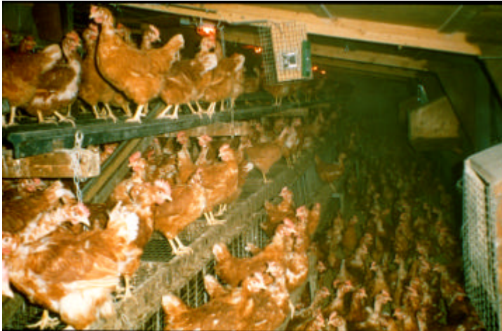
Abb. 6: In Hühnerställen mit hoher Besatzdichte verbreitet sich das Geflügelpestvirus explosionsartig, aber der Ursprung der Seuchenzüge liegt eher in Kleinbetrieben, wo Wildvögel und verschiedene Arten von Hausgeflügel engeren Kontakt haben können.

Um der Entstehung der Geflügelpest vorzubeugen, sollte Hausgeflügel keinen Kontakt mit wilden Wasservögeln haben. Bei Freilandhaltung sind entsprechende Schutzmaßnahmen zu treffen, zumindest darf die Fütterung nicht im Freien erfolgen, um keine Wildvögel anzulocken. Außerdem sollten Hühner und Puten nicht mit Wassergeflügel zusammen gehalten werden.