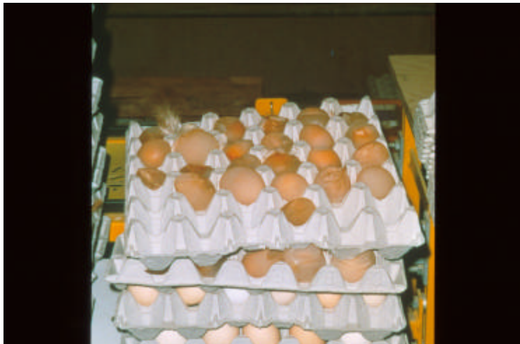
Abb. 1: Die Legeleistung fällt bei an Geflügelpest erkrankten Hühnern stark ab und die Schalen der noch gelegten Eier sind dünnwandig, oder fehlen ganz.

Enten und Gänse erkranken nicht so schwer und die Krankheit führt nicht immer zum Tod. Manchmal leiden sie nur an einer Darminfektion, die äußerlich fast unauffällig verläuft.