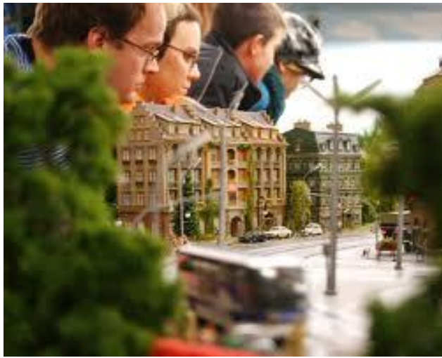
Da gibt es was zu staunen!!!