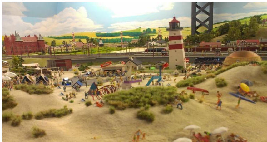
Wenn jetzt Sommer wär... im Juni ist Sommer!