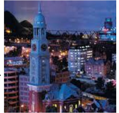
Hamburg bei Nacht! WOW!