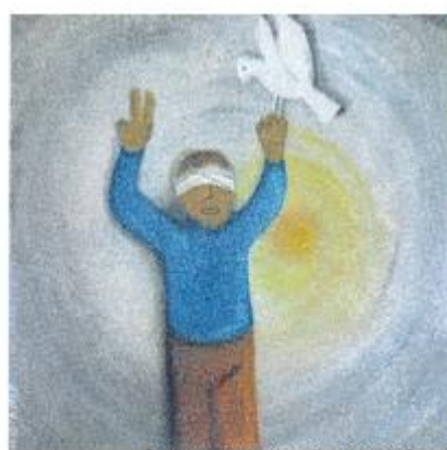
„Der Junge mit verbundenen Augen“ Anahita Osman Das Bild zeigt wie Kinder in Syrien unter dem Regime leiden, weil sie es ablehnen und sich mit einem Protest für Demokratie, Freiheit und Würde einsetzen

Begleitet wird die Ausstellung in Eutin an drei Samstagen mit Mal- und Leseaktionen. An diesen Tagen haben Kinder und Erwachsene die Möglichkeit, in der Kreisbibliothek selbst künstlerisch aktiv zu werden. Außerdem können sie Geschichten in unterschiedlichen Sprachen lauschen.