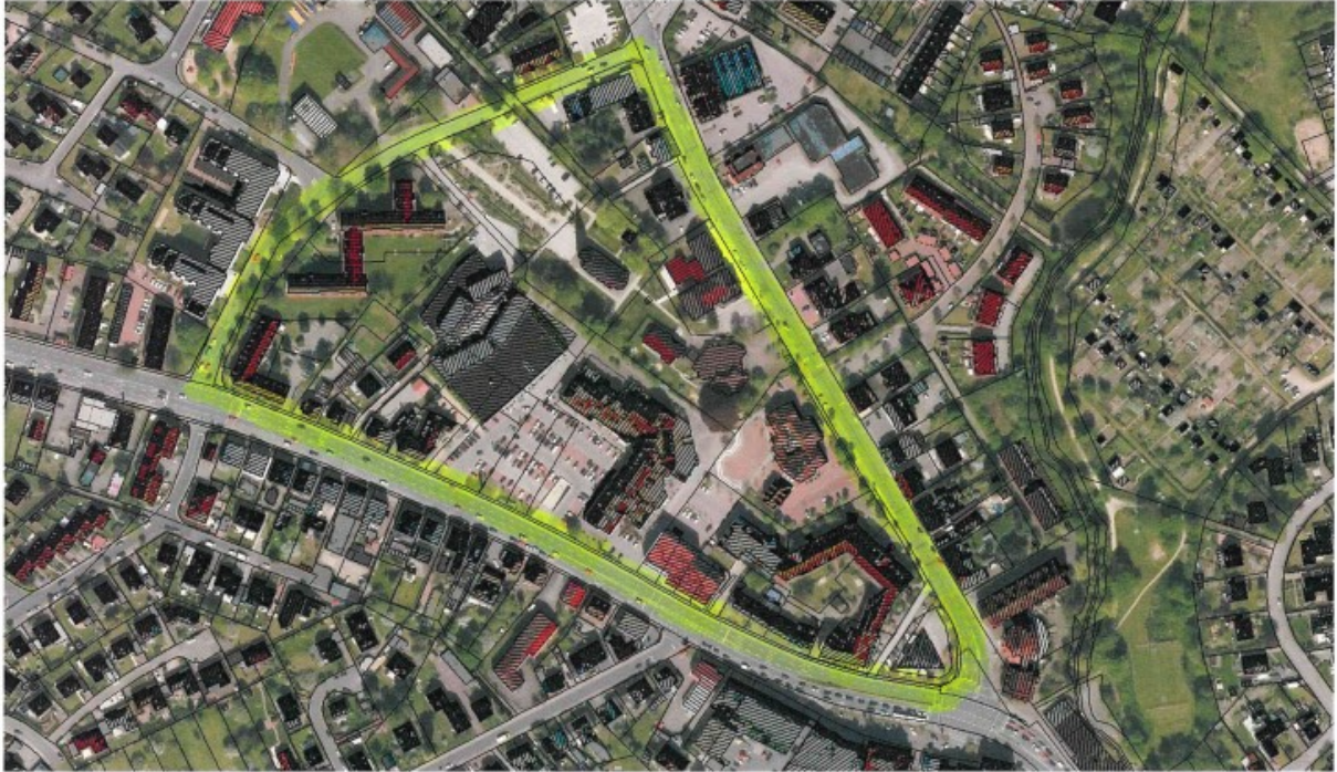
Alkoholverbot im Ortszentrum der Gemeinde Stockelsdorf (Aufenthaltsbereich im Dreieck Segeberger Straße/ Marienburgstraße/ Ahrensböcker Straße)