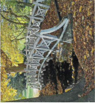
Brücken verbinden: Ufer mit Ufer, hier mit dort.